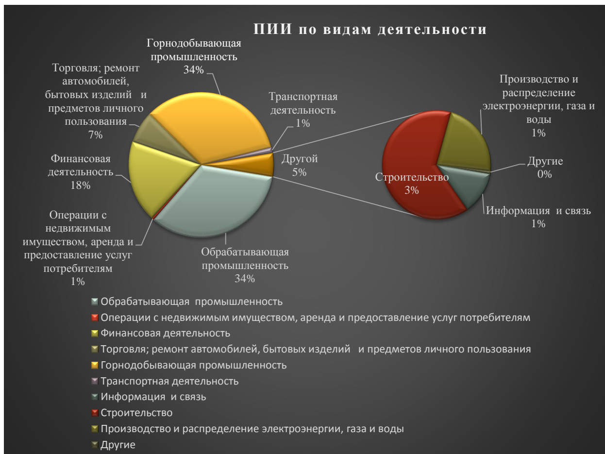
Таблица 1. Поступление ПИИ за 2013-2014 годы по видам экономической деятельности. (в тыс. долларов США)