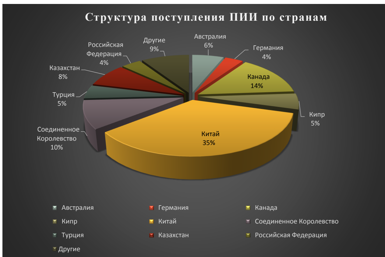
Рисунок 3. Доли стран в структуре поступления ПИИ за 2014 год

Приток ПИИ из стран СНГ в 2014 году, осуществленных инвесторами из Казахстана — составил 46,7 млн. долларов США, из Российской Федерации составил 21,8 млн. долларов США. Остальные 0,1 млн. долларов ПИИ из стран СНГ приходятся на Таджикистан, Узбекистан, Украина и Беларусь.