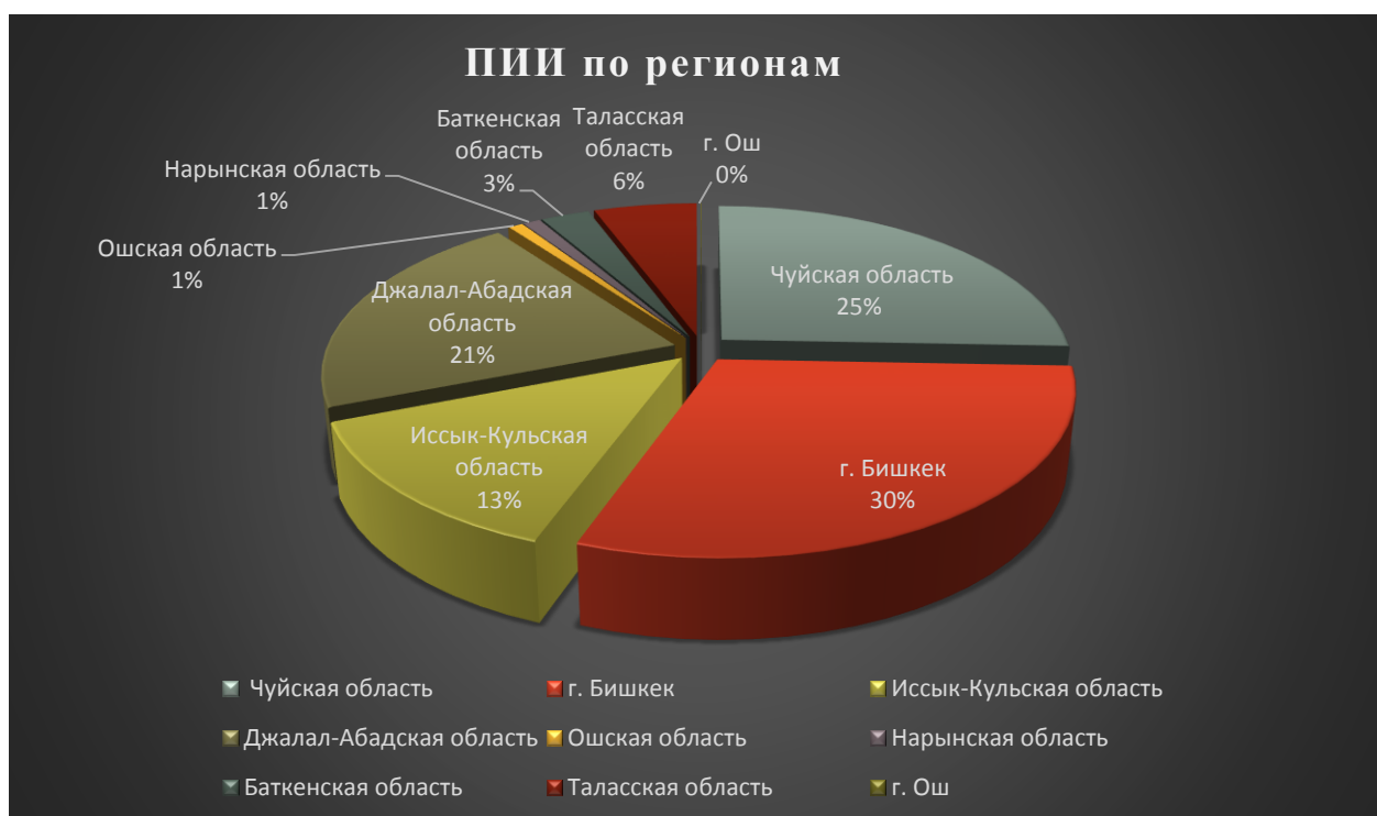
Рисунок 4. Объем поступления ПИИ в регионы КР

Структура поступления ПИИ отражает неравномерное развитие регионов страны, основная часть ПИИ сконцентрирована в г. Бишкек и в Чуйской области. По итогам 2014 года, наибольший удельный вес поступивших прямых иностранных инвестиций приходился в г. Бишкек, сумма которого 182,1 млн. долларов США; на Чуйскую область в сумме 155,9 млн. долларов США; Джалал-Абадская область 127,6 млн. долларов США. Наименьший удельный вес поступлений ПИИ приходится на город Ош, составляя 216,0 тыс. долларов США, что составляет 0,0% от всего объема ПИИ.